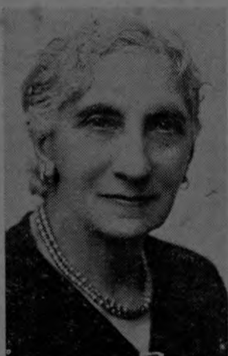
en sus labios la sonrisa que da la certeza del deber cumplido.

Cuando se sienta en un rincón de la sala de su casa, a repasar las páginas de su vida, se le inflama de entusiasmo el corazón y se dibuja